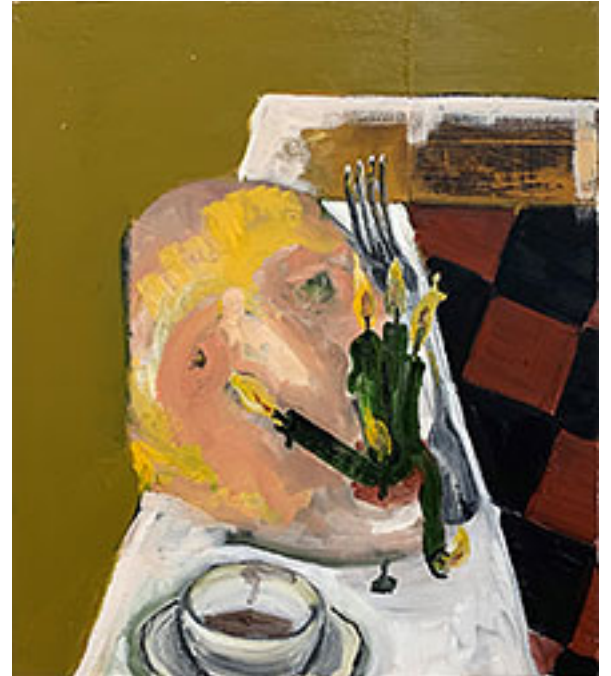
© Victor Boulet. Foto: Anna Bohman Gallery